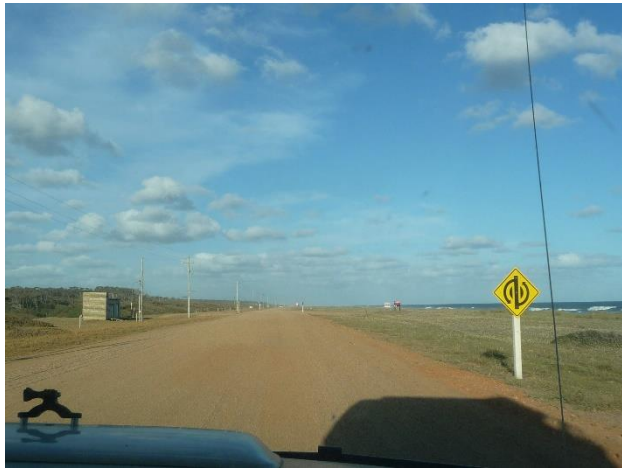
Sur une piste de ripio.