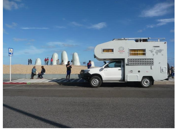
Sculpture de la Mano à Punta