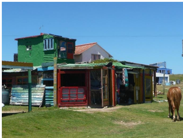
Le village hippie de Cabo Polonio