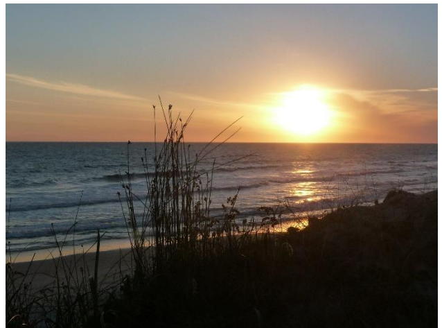
Seuls au monde !