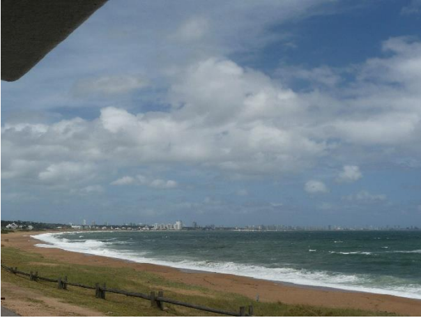
Punta del Este