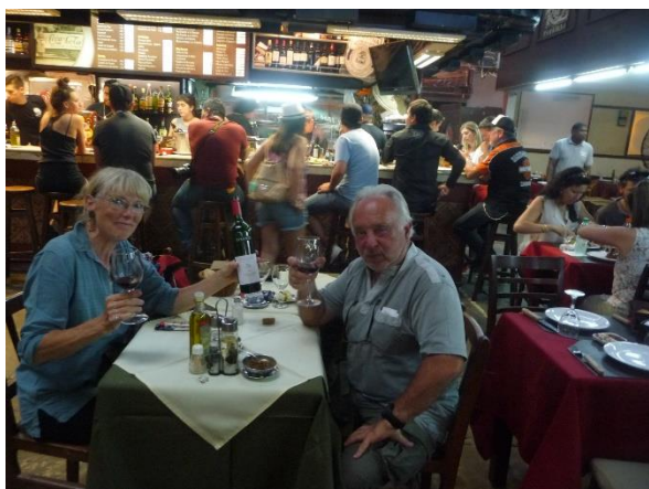
Marché du port