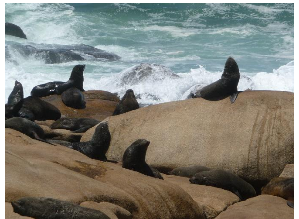
Les lions de mer à Cabo Polonio