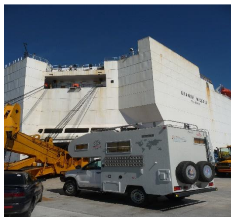
Arrivée à Montévidéo

Ville et pays à l'histoire compliquée et mouvementée depuis les premières expéditions européennes à l'intérieur du fleuve Rio de la Plata, « l'âge de cuir » des années 1750, les différentes colonisations des pays voisins, puis les dictatures militaires. L'Uruguay est désormais une démocratie qui fait partie du Mercosur, sorte de marché commun de l'Amérique du sud.