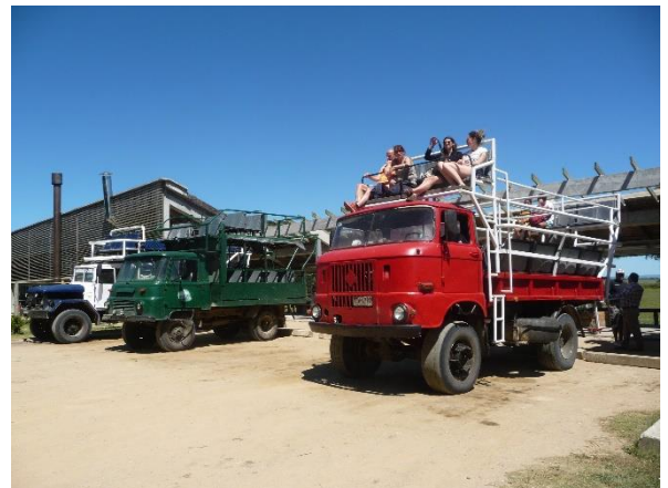
Autres troupeaux. Touristiques. Dont nous !!!