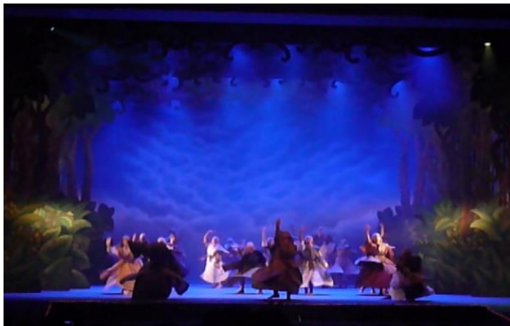
L'Opéra de Manaus