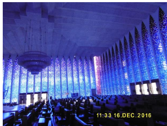
La cathédrale et l'église Dom Bosco