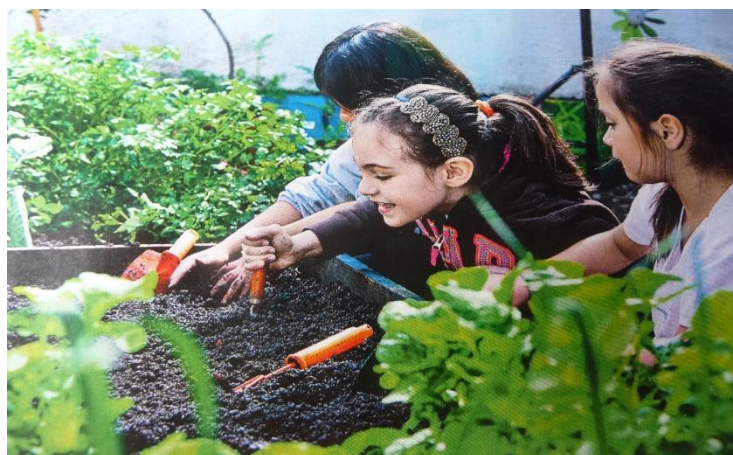
Initiation des écoliers à la culture écologique en serre