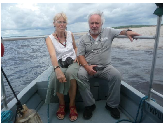
En pirogue sur l'Amazone !

A Manaus, il y a un Opéra, avec des grands concerts de musique classique, et surtout on y voit une chose étrange, la rencontre de 2 fleuves, un noir, le Rio Négro, et un jaune, le Solimões qui vont former l'Amazone, mais comme ils n'ont pas la même vitesse, la même température, ni la même densité, ils ne se mélangent pas tout de suite ! Il faut 15 km !!!!