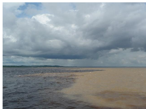
La ligne de rencontre des eaux.