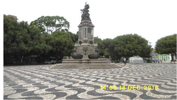
La place de l'Opéra

Et les indiens, me direz-vous, où sont-ils ? Il y a environ 1 million d'indiens au Brésil, répartis en 305 ethnies différentes, et parlant 274 dialectes. Ils ne sont pas loin de là, mais il est très difficile de les voir car ils vivent généralement cachés dans les forêts. Ils sont sur leurs territoires ancestraux, dans 600 réserves protégées et représentant 12.5 % du total du pays. L'accès est interdit pour les laisser vivre en paix. Ils sont principalement en Amazonie, au nord, au nord-est et dans le Mata Grosso.