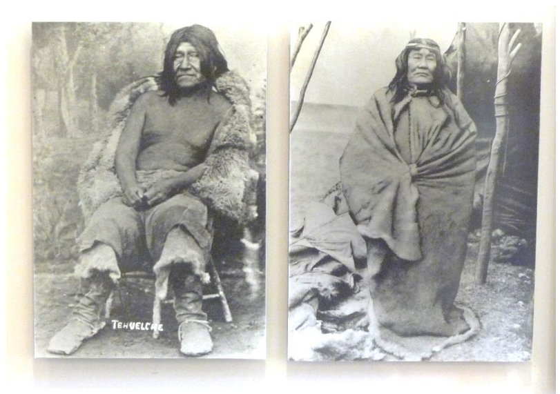
Photos des derniers représentants TELHUECS

Etonnante cathédrale « brut de béton » de Bariloche