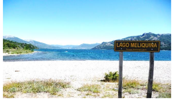
Ah ! les truites du lac Meliquina !!!

Puis superbe route jusqu'à San Martin de los Andes, où nous passerons la nuit