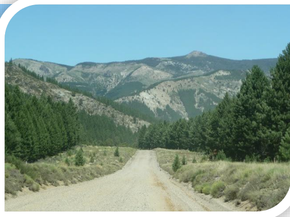
La Pampa et ses Gauchos.....