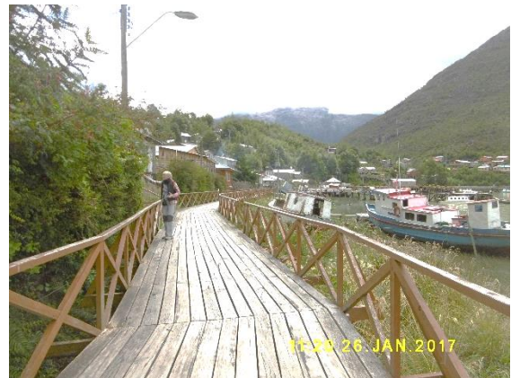
Le réseau de passerelles de Caletta Tortel