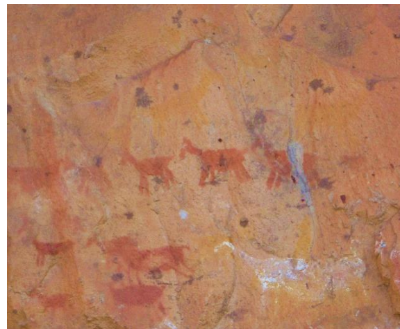
Scènes de chasse aux guanacos

... Et de dormir au bord de cette Ruta 40, au milieu de nulle part !