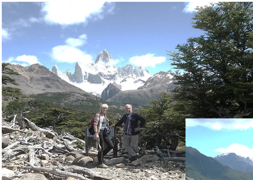
Mirador de Fitz Roy