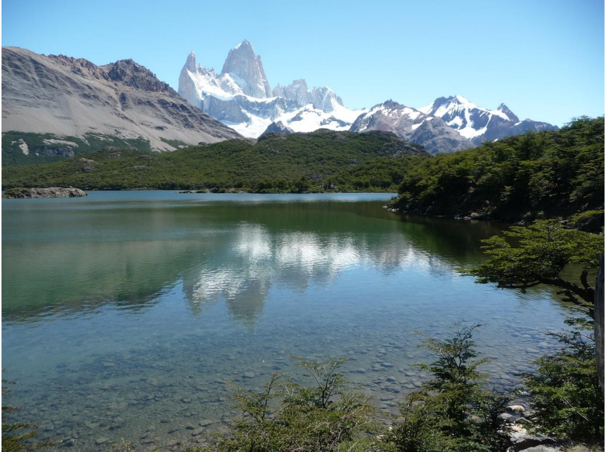
Le Fitz Roy vu de la Laguna Capri

Durant notre périple, nous ne donnons jamais de conseils, car voyager est une question très personnelle, et chacun a ses options. Et ce sont les bonnes. Mais là, il faut rappeler à tous les Amis voyageurs que l'été austral c'est du 15 Janvier à fin Février !