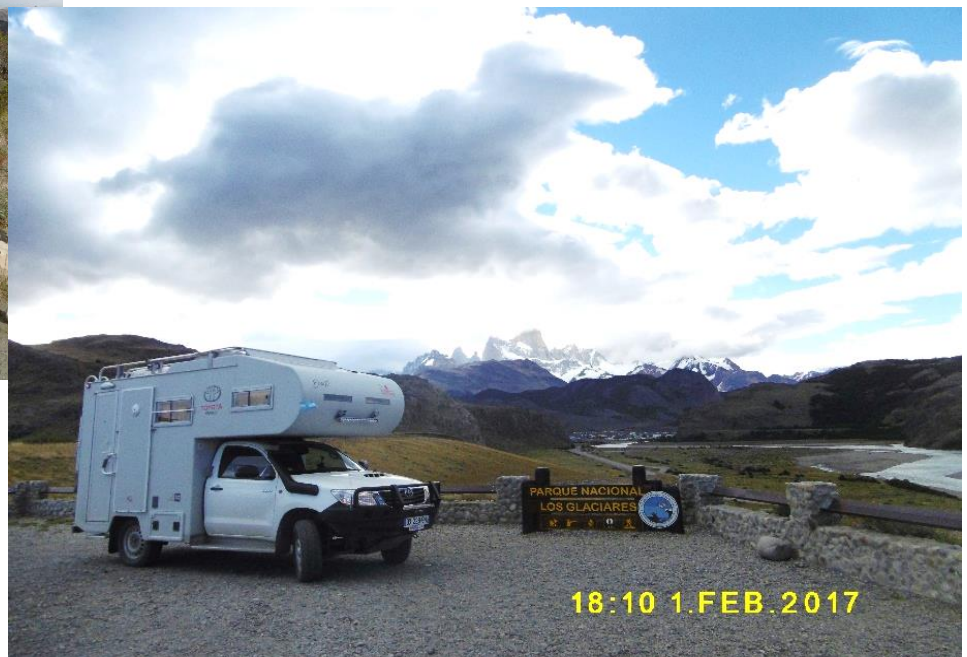
Arrivée au Parque Nacional de los Glaciares : au fond, le Fitz Roy