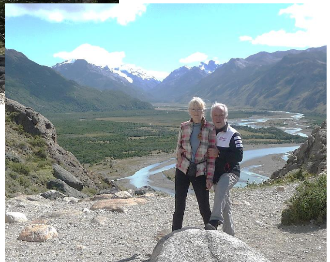
Mirador de Las Vueltas : au fond la vallée allant au Lago Désierto