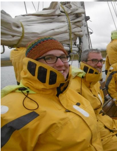
Pingouins jaunes ! Il n'y a qu'ici qu'on les rencontre !