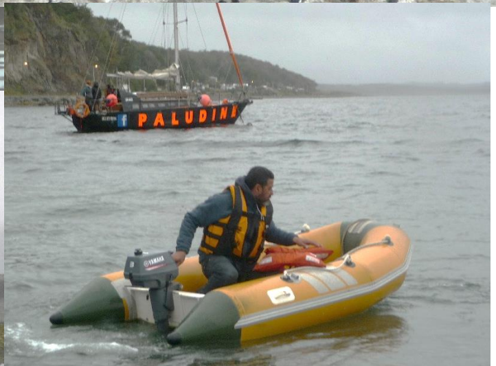
Le commandant du Paludine