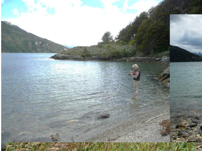
Le beau temps est de la partie !