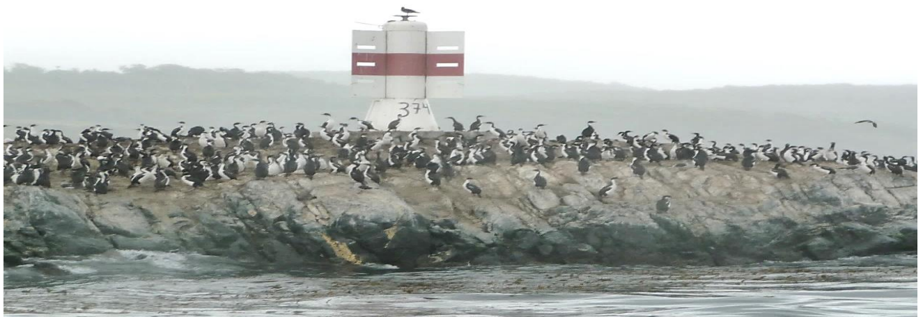
Plutôt que le classique phare des éclaireurs, la balise de l'île des Gemelos !