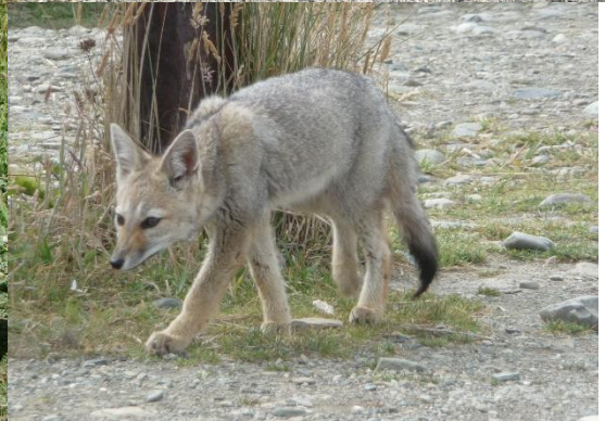
Le renard n'est jamais loin !

Après 8 km de randonnée dans le décor somptueux des rives du Canal de Beagle, (mais