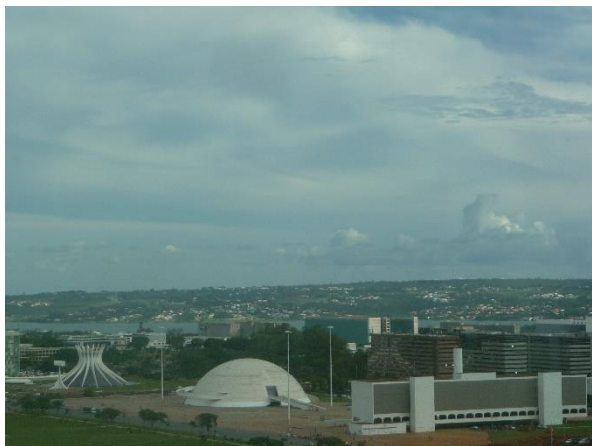
Vue de notre chambre

Aucun touriste rencontré en 2 jours sur place, et le magnifique hôtel Winsdor nous a même surclassé dans une suite...pour encourager les trop rares visiteurs ! 13 ème étage, avec vue sur l'avenue et la Cathédrale ! Une aubaine !