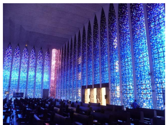
Sanctuaire de verre de Dom Bosco, le visionnaire.

Sanctuaire de Dom Bosco, vaste espace de 1600 m 2 dont les murs en hauts vitraux de verre bleu, mauve et rose, avec une dominante des 12 tonalités de bleu. Une splendeur !!!