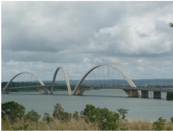
Pont J. Kubitschek (récent 2002)

Et c'est avec un mini bus, que de l'hôtel, nous partîmes en visite !