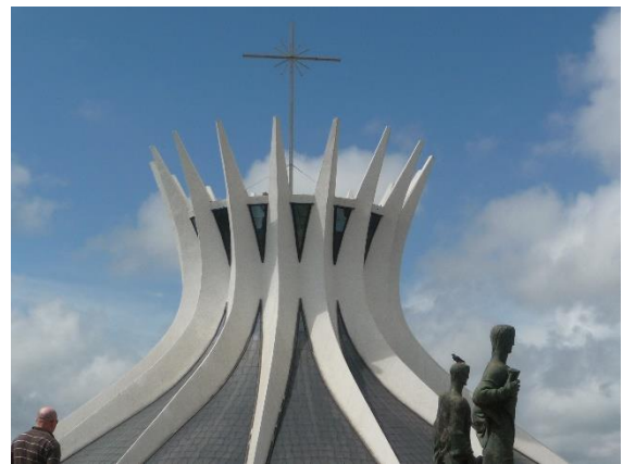
La Cathédrale du Sculpteur O. Niemeyer