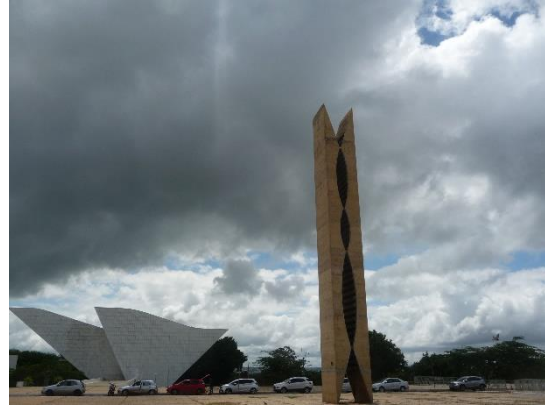
Place des Trois Pouvoirs

Certes, beaucoup de symbolique dans tout cela, mais les années soixante en avaient besoin ! Magnifique visite en réalité, et les touristes ont peut-être tort de ne pas y venir !