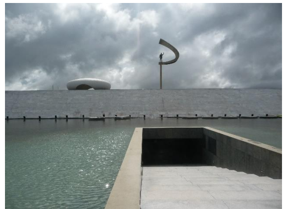
Panthéon J. Kubitschek

Impressionnant et très intéressant mausolée de Kubitschek, avec une foule de documents d'époque, photos et films, sans compter la reconstitution de sa bibliothèque. Puis passant par la Torre de Télévision, avec ses 224 m de haut