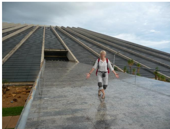
Brasilia ! J'en rêvais ! J'y suis !